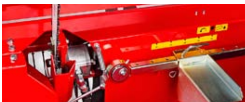
Kraftig oljemotor sagkjede og justerbar pumpe kjedesmøring.