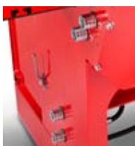
Uttak for stokkebord/stokkeløft. (Ekstrastyr)

Justerbar smørepumpe sikrer lengre vedlikeholds intervall for sagkjede og sverd. Kjedeolje kommer fra en separat oljekanne som er enkel og skifte/etterfyller. Den åpne og lave konstruksjonen muliggjør enkel service/rengjøring. Egen verktøykasse kan være «kjekt å ha». Et stort utvalg av ekstrastyr gjør at maskinen kan tilpasses dine spesielle ønsker.